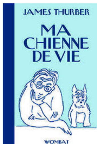
@Nouvelles éditions Wombat