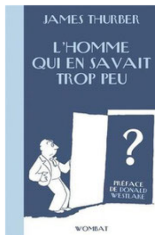
@Nouvelles éditions Wombat